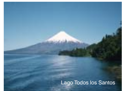
Lago Todos los Santos

Otros seleccionados fueron el Lago Todos los Santos y los Saltos de Petrohué, en la Región de Los Lagos. Las aguas del lago, se caracterizan por el color turquesa, las que contrastan con los volcanes Osorno, Puntiagudo y Tronador, que la mayoría del año están nevados. La fuerza de los Saltos es un espectáculo imperdible.