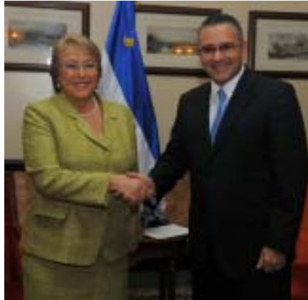
Presidenta Michelle Bachelet junto al Presidente de El Salvador, Mauricio Funes.