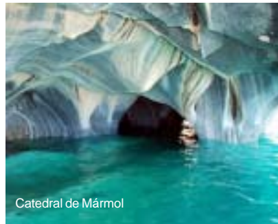
Catedral de Mármol

En la misma región figura la espectacular Catedral de Mármol del Lago General Carrera que constituye una formación mineral debido a la erosión en escarpes costeros del lago en hermosas formas y colores, la cual se recorre en pequeñas embarcaciones; Campos de Hielo Sur, la tercera mayor extensión de hielo del mundo situada en los Andes patagónicos con 16.000 kilómetros cuadrados –de los cuales 14.000 están en Chile–; y el río Baker, con una longitud de 370 kilómetros, el segundo más grande de Sudamérica, y uno de los favoritos para pescar salmón.