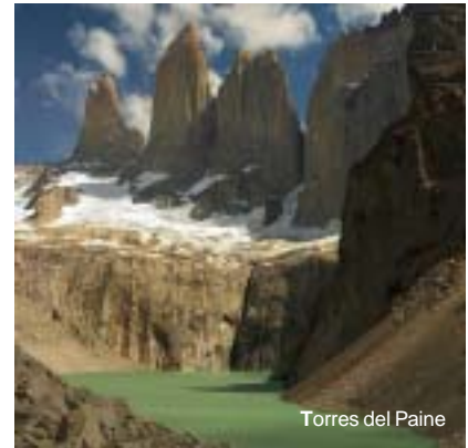
Torres del Paine

Fueron 25 los preseleccionados, pero sólo siete los elegidos por académicos y expertos en turismo y patrimonio, así como por votación vía Internet –con más de 7.000 votos–. El que recibió la mayor votación fue el Parque Nacional Torres del Paine, ubicado en la Región de Magallanes, –Reserva de la Biosfera desde 1958 comprende 242 hectáreas de montañas, valles, ríos, lagos y glaciares. Otra elegida fue la Laguna San Rafael, de la Región de Aysén, de origen glaciar cercano a Campos de Hielo Norte.