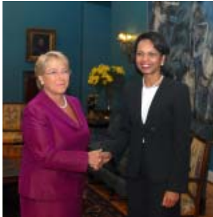
Presidenta Michelle Bachelet recibe a Condoleezza Rice, secretaria de Estado de Estados Unidos.