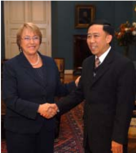
Presidenta Michelle Bachelet recibió en audiencia al Viceprimer ministro y ministro de Comercio de Tailandia, Mingkwan Sangsuwan.