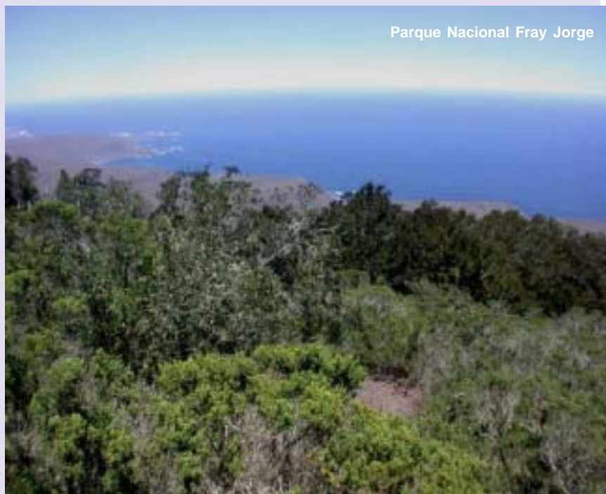
Parque Nacional Fray Jorge

Más al sur, en la región conocida como Norte Chico, el Parque Nacional Fray Jorge es un frondoso contraste con los alrededores más áridos. La precipitación promedio anual es de 113 mm., pero debido a la condensación de la neblina costera, se formó un bosque hidrófilo. Olivillos, canelos y gran variedad de helechos sobreviven desde épocas prehistóricas a más de 1.250 kilómetros al norte de su hábitat natural, la zona de Valdivia. Es Reserva Mundial de la Biosfera.