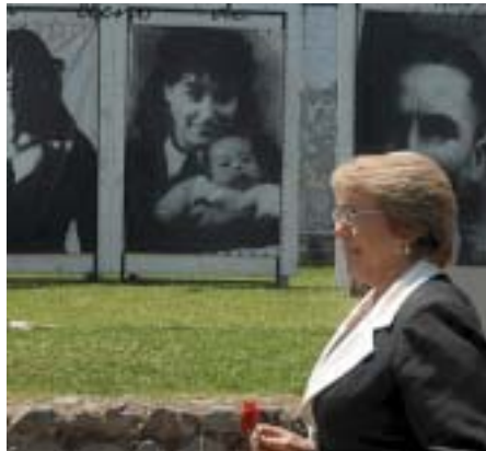
Presidenta Michelle Bachelet en inauguración del Memorial del Partido Socialista en Villa Grimaldi.